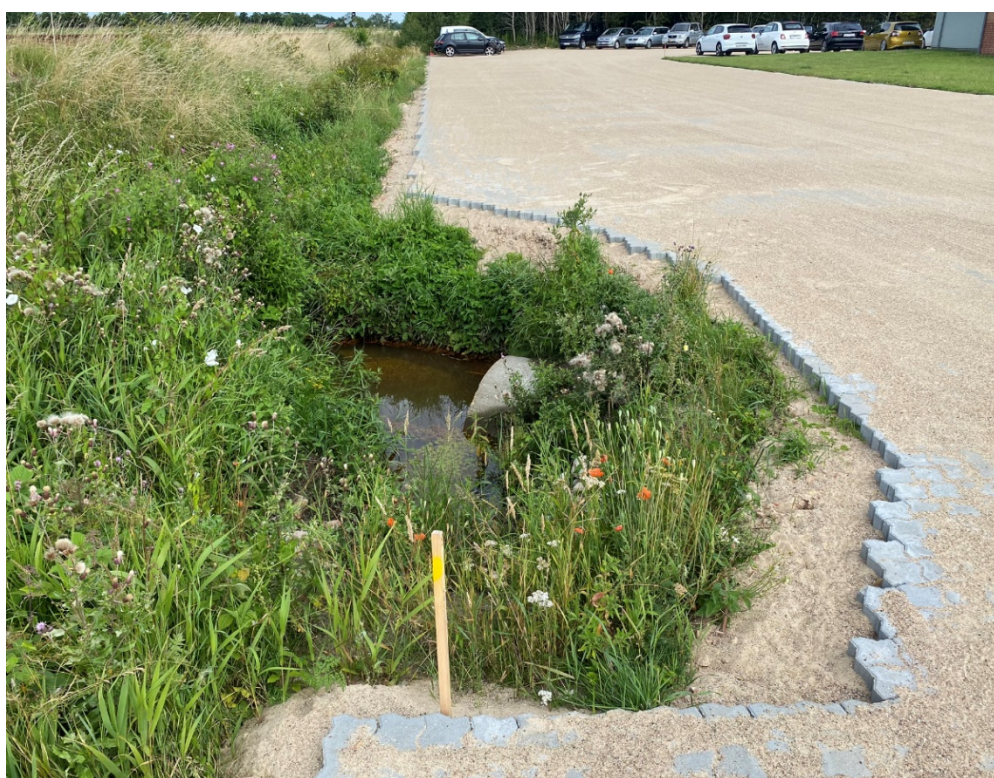
Figur 2. Foto fra besigtigelsen den 26. august 2020. Mellem stenbelægningen og starten på banearealet, bliver det opsat hegn, hvorfor "indhakket" ønskes inddraget og stenbelagt, så stenbelægningen flugter. det kræver forlængelse af udløbsrøret fra Galgemærksgrøften med 2 m.